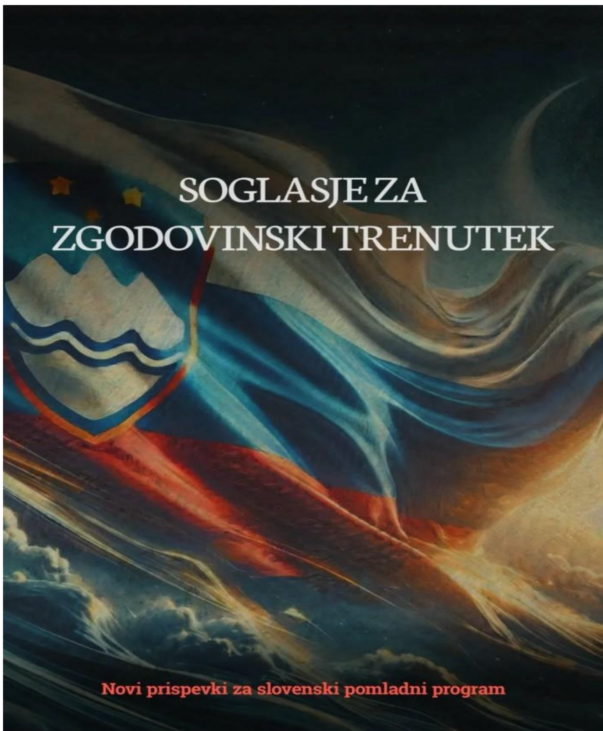
Naslovnica novega Jambrekovega zbornika