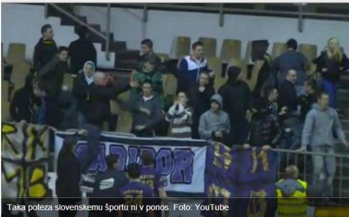
Taka poteza slovenskemu športu ni v ponos.

MARIBOR, GRADAČAC – »To niso naši navijači niti nismo ponosni na njih. Nekaj posameznikov je prišlo na tekmo verbalno izzivat devet gostujočih navijačev. V klubu se bomo te problematike lotili izjemno resno, že danes pa lahko zatrdim, da bomo naredili vse, da takim