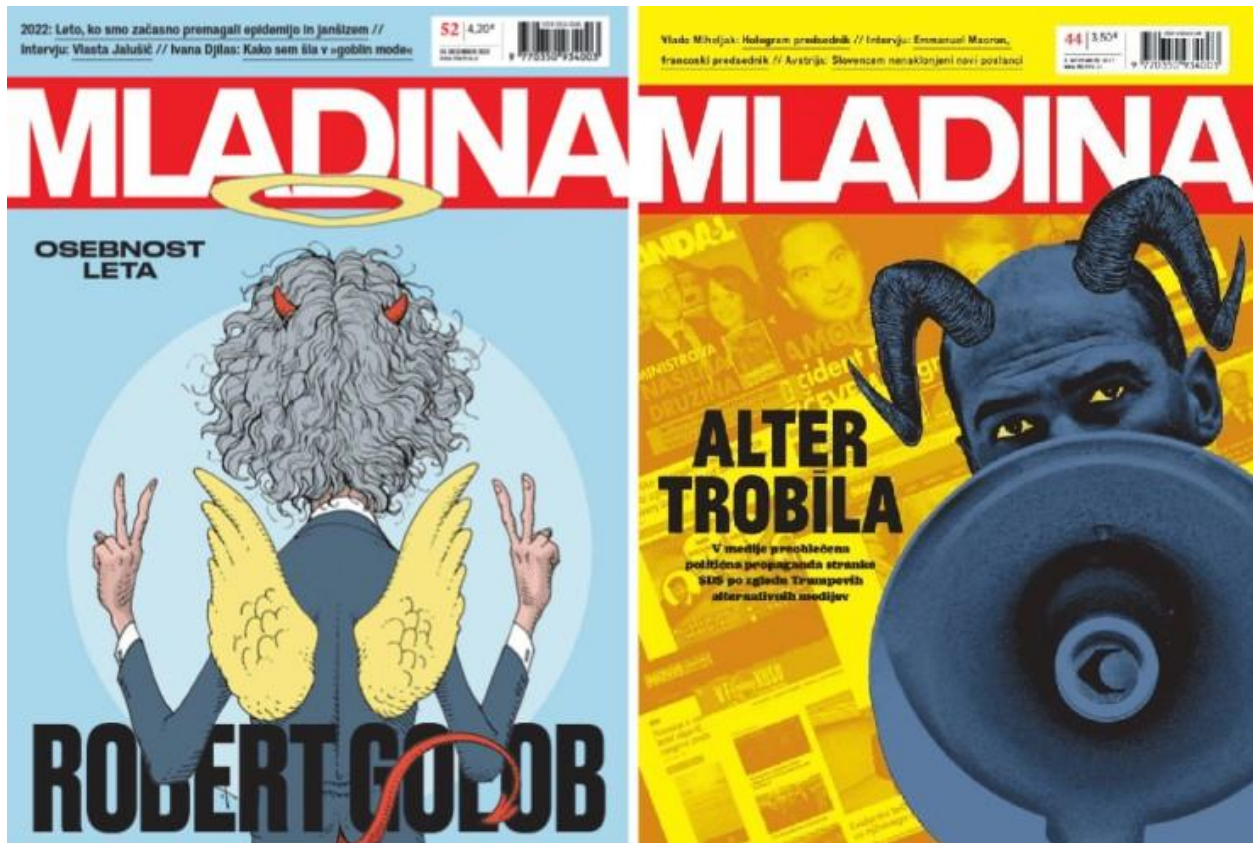
Dva predsednika vlade na naslovnica Mladine, le da je en tudi malo angel