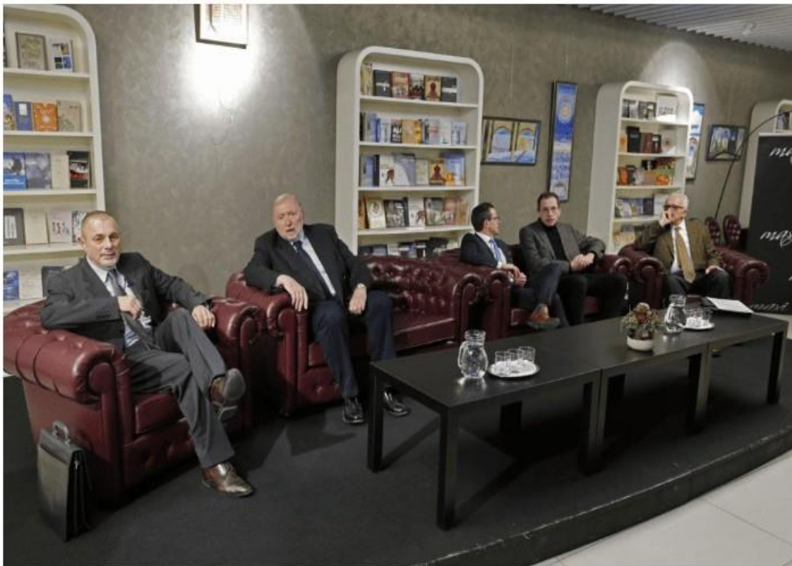
Katedrala svobode združuje vidnejše glasove desnice.

Katedrala svobode v spomenici hvali vlado Janeza Janše, primerja epidemijo s socializmom in upa na preporod slovenske družbe.